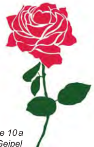
Die Klasse 10a